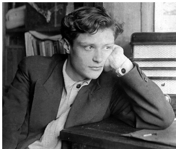
Эвальд Васильевич Ильенков

Evald Ilyenkov on the Freedom of the Will Pp. 89–96