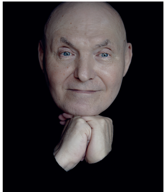
Александр Васильевич Суворов