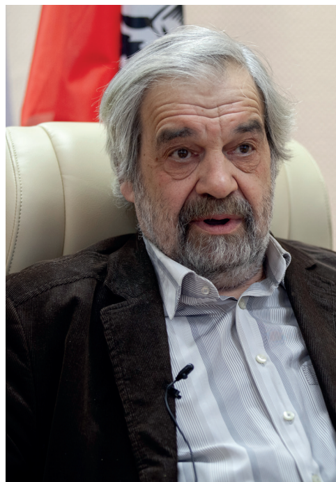
Борис Даниилович Эльконин