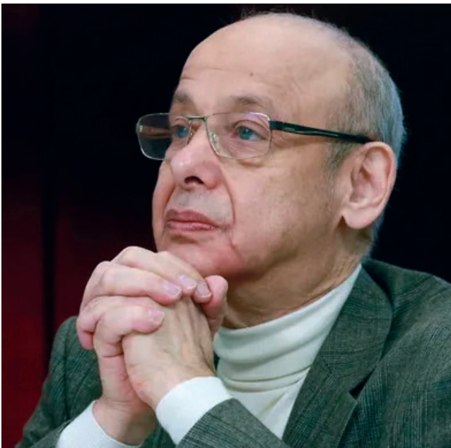
Александр Григорьевич Асмолов