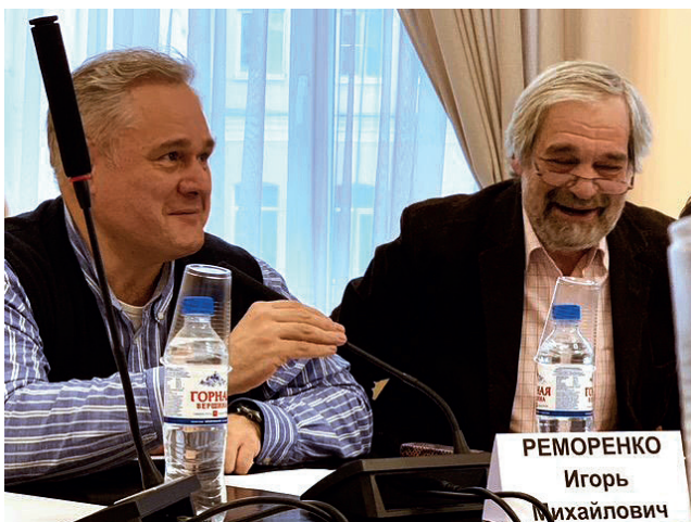
Б.Д. Эльконин и И.М. Реморенко.

Когда Бориса Даниловича приглашали на разные конференции и семинары, всегда ожидали от него или установочных, рамочных, базовых суждений, или обобщения, участия в конструировании выводов.