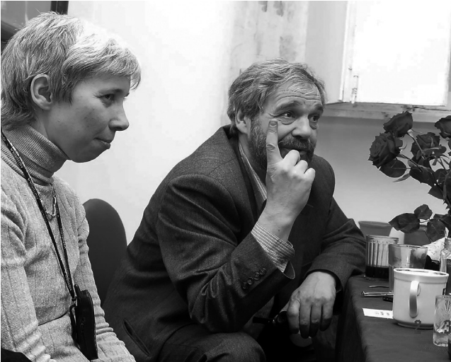
Б.Д. Эльконин с Е.В. Чудиновой

Вклад Б.Д. в психологию — новое понимание психического развития, новое понимание Действия, а еще — яркая и живая энергия школы Л.С.Выготского, протяннутая, переданная от старших поколений младшим.