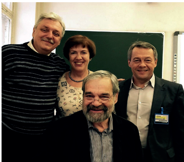
На конференции в Ижевске по антропопрактикам развития (2015 г.).

Благодарим всех, кто отозвался на предложение и просьбу редакции!