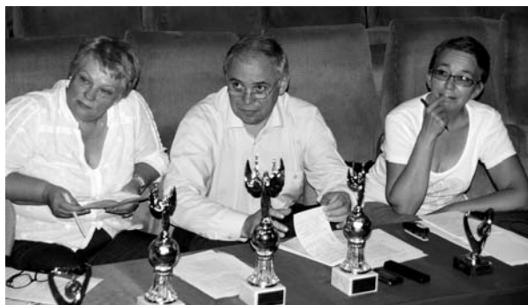
Жюри за работой