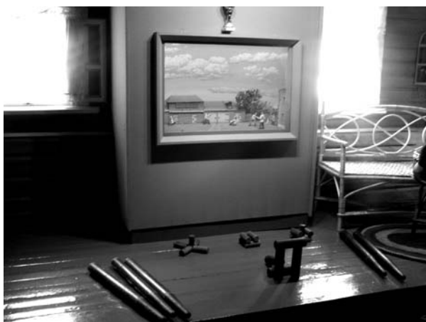
Игра в городки здесь была любимой формой отдыха