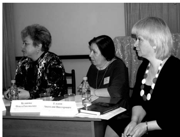
Руководители секций не только внимательно слушали выступающих, но и вступали с ними в полемику

Но доклады руководителей секций, которые определяли основные направления их работы, с интересом прослушали все: «Логика и объект психологии: от