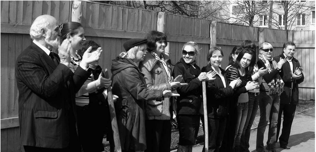
В игре, как и в жизни, побеждает дружба

чикам, а некоторые вызвали целые дискуссии. Может быть, этому способствовала экскурсия по дому и лабораторному корпусу мемориального комплекса, во время которой мы познакомились не только с жизнью и укладом семьи И.П. Павлова, но и с его подходом к научной деятельности, предполагающим широкое обсуждение любой новой идеи.