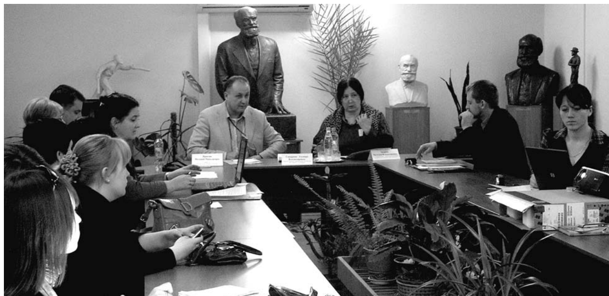
Работа на секциях проходила по-павловски активно

Организаторы конференции уверены, что личность И.П. Павлова, великого ученого и мыслителя, является знаковой для развития науки конца XIX — середины XX века. По инициативе администрации г. Рязани 2009 год объявлен годом академика Павлова в связи с 160-летием со дня рождения и 105-летием со дня присуждения ему Нобелевской премии. Об этом на открытии конференции собравшимся напомнил начальник управления культуры и искусства ад-