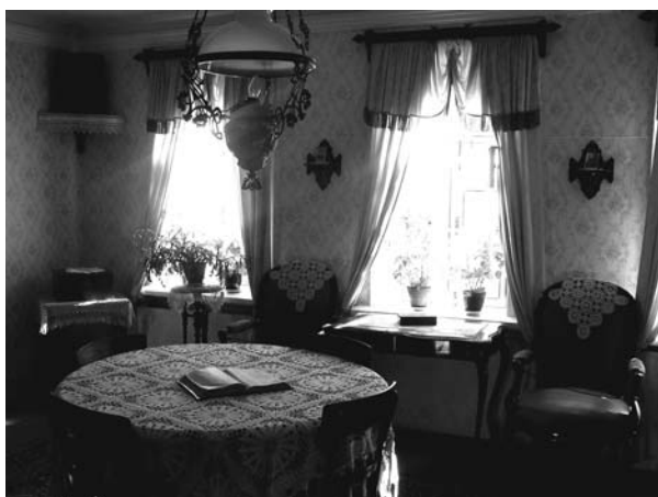
Сотрудники дома-музея считают, что теплая домашняя атмосфера способствовала становлению личности И. П. Павлова

министрации г. Рязани А.А. Кашаев. Он отметил, что конференция, большая часть которой проходит на территории дома-музея Павлова, объединяет науку и культуру города. И.П. Павлов был человеком, одаренным во многих областях, это позволило объединить в рамках конференции не только психологов разных направлений, но и медиков, физиологов.