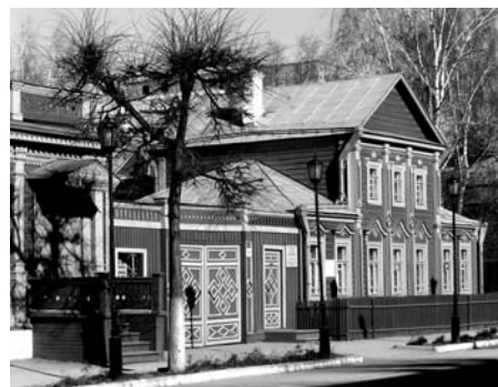
Мемориальный музей-усадьба академика И.П. Павлова

«... я не только физиолог, но и человек, думающий на разные темы»