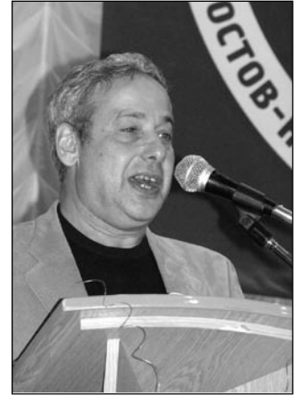
А.Г. Асмолов как всегда — великолепный оратор

Это приводит к тому, что отсутствует единство в профессиональной идентичности. И практики, и методологи бегут в разные стороны. Это состояние А.Г. Асмолов определил как методологический либерализм, в конечном итоге приводящий к разного рода шарлатанству под видом оказания психологической помощи. Отвечая на вечный вопрос: «что делать?», Александр Григорьевич обратился, в частности, к нерешенным до сих пор вопросам общественной сертификации, а также более активного вмешательства психологов в проблемы общественной и госу-