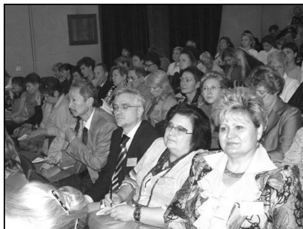
Делегаты и участники

Надо признать, что большинство из этих задач актуально и сейчас. И проблемы, озвученные на трех предыдущих съездах плавно переадресовались четвертому съезду.